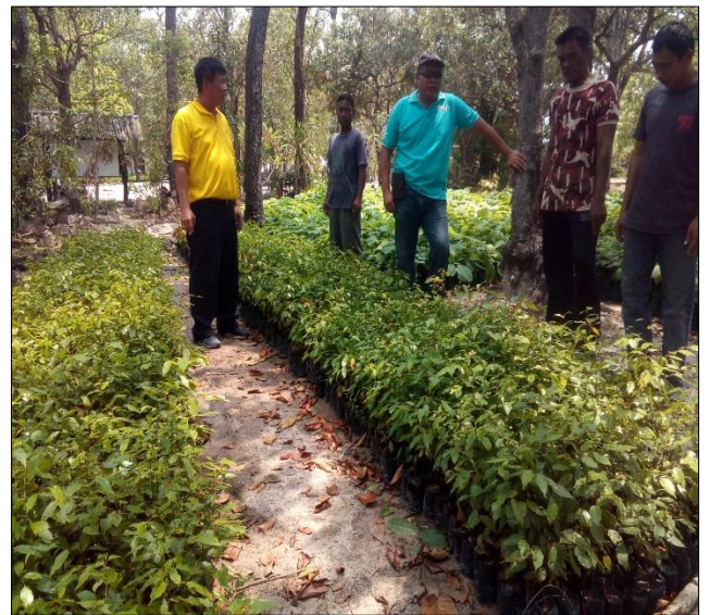
ดำเนินการดูแลบำรุงรักษากล้าไม้ และแจกจ่ายกล้าไม้ให้กับหน่วยงาน หรือประชาชนทั่วไป