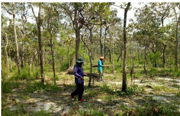
ขนกล้าหวาย และปลูกต้นหวาย