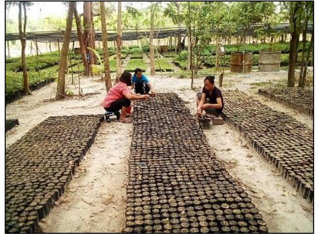
ดำเนินการดูแลบำรุงรักษากล้าหวาย