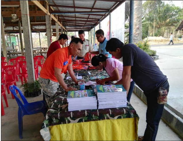
พิธีเปิดการฝึกอบรม