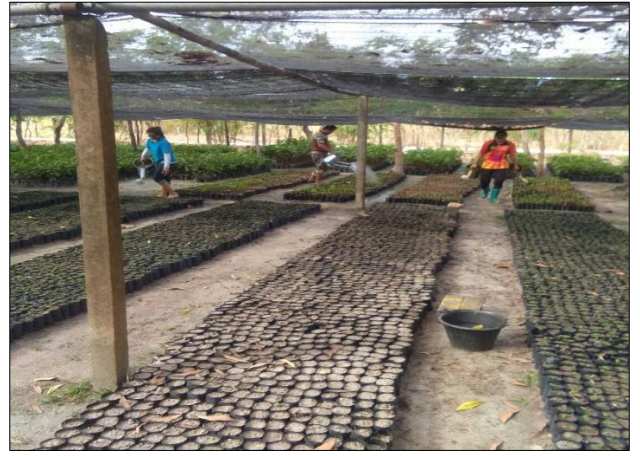
ย้ายชำกล้าหวาย