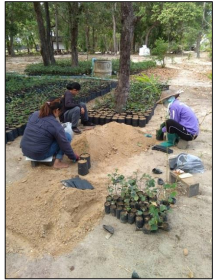
ดำเนินการดูแลบำรุงรักษากล้าไม้