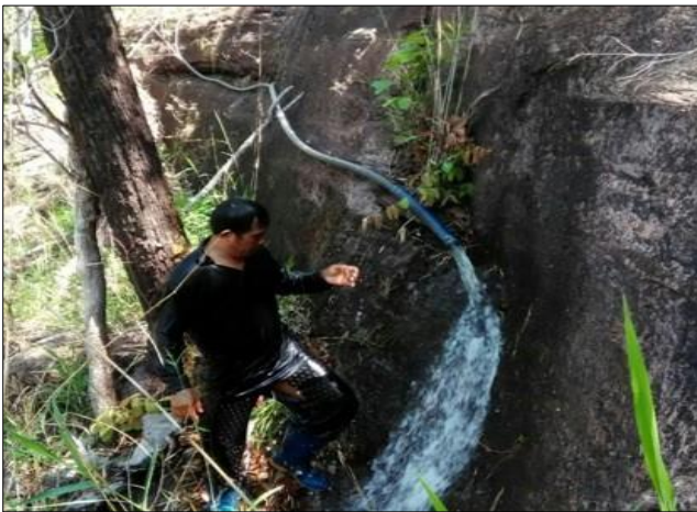
พื้นที่ป่าเปียก