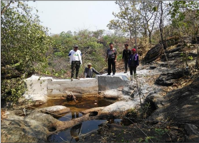
จัดทำระบบป่าเปียก

ก่อสร้างกักเก็บแหล่งน้ำ พิกัดกลางแปลง UTM ZONE 48 P Easting 562399 Northing 1710857