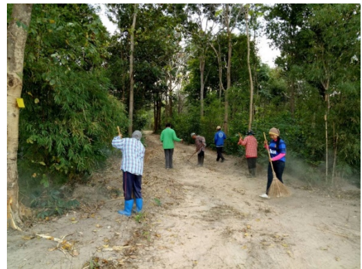
ภาพถ่ายระหว่างทำแนวกันไฟ