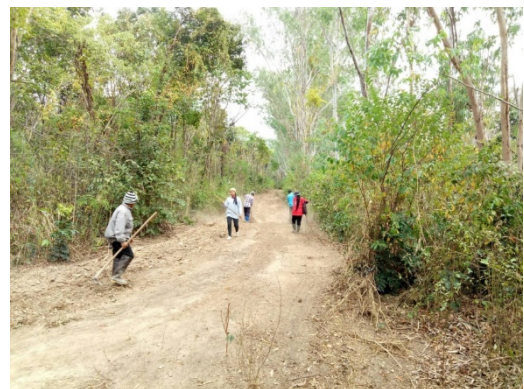
ภาพถ่ายหลังทำแนวกันไฟ