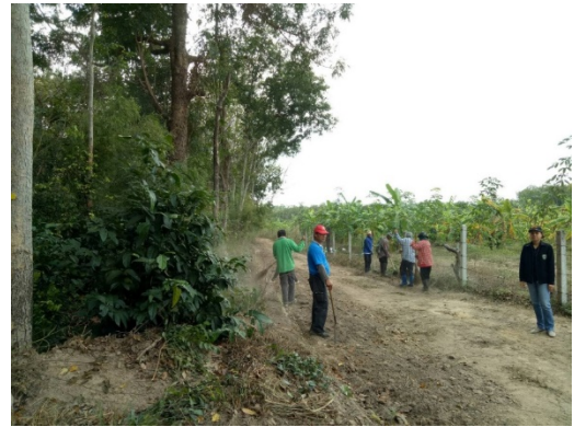
ภาพถ่ายก่อนทำแนวกันไฟ