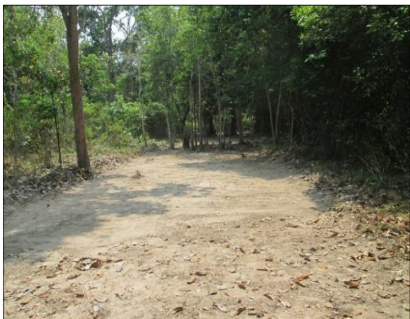
ภาพกิจกรรม การจัดทำแนวกันไฟ (ระยะทาง ๓๕ กิโลเมตร)