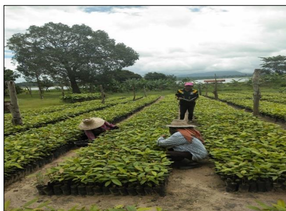
ภาพกิจกรรม การปฏิบัติงานที่ได้รับมอบหมาย ของหน่วยจัดการต้นน้ำห้วยโตง-ห้วยด่าน